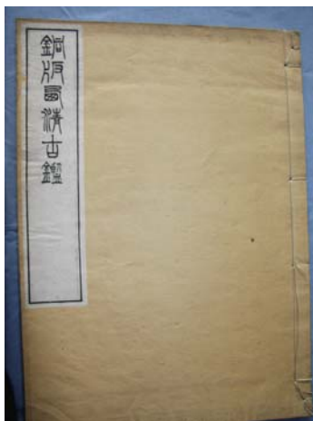
馆藏名品《西清古鉴》