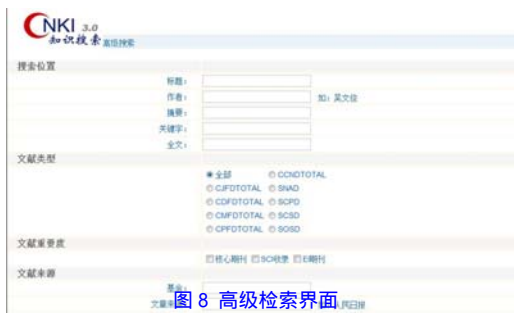
图 8 高级检索界面

高级检索界面有 4 个检索文本框，可以同时使用 4 个检索字段，这 4 个字段既可以相同，也可以不同，输入检索词后，单击各文本框右边下三角按钮，在出现的下拉列表中根据检索需要选择一个逻辑算符，然后与初级检索时一样，选择检索范围，指定检索时间及结果排序方式，最后单击“检索”按钮（如图 8）。