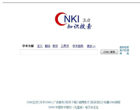
图 7 初级检索界面

需要注意的是，由于 CNKI 的二次检索是在上一步检索结果的基础上增加限制条件，从而缩小检索范围，即执行二次检索的结果只能是记录越来越少，而不可能使记录数增加，因而在实际检索时，不要一开始就将检索条件限定的很严格，应充分利用二次检索功能，逐步缩小检索范围，以最终获得较为满意的检索结果。