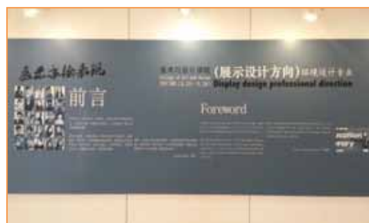
2015年3月23日，美术与设计学院展示设计效果图课业展