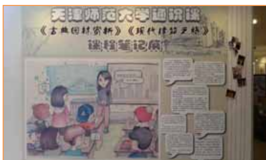
2015年4月1日，我校通识课程《古典园林赏析》、《现代建筑之旅》课程笔记展