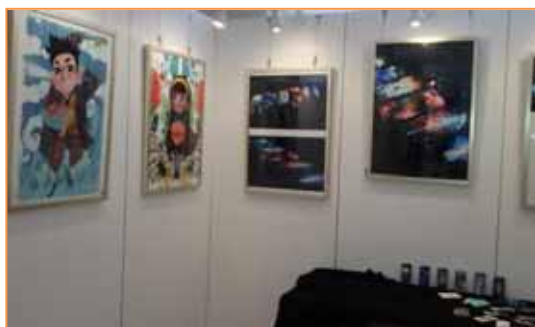
2015年6月18日，美术与设计学院设计作品展