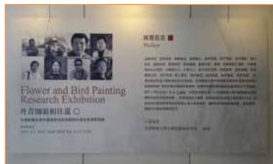
2015年5月12日，天津师范大学中国画研究所特聘研究员花鸟画教研展